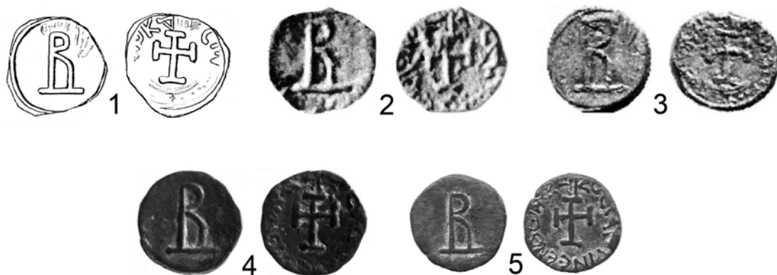
Рис. 3. Херсоно-византийские монеты с «В» на аверсе и с крестом, окруженным надписью ΚΟΝΣΤΑΝΤΙΝΟΥ ΝΙΚΗ на реверсе

1 — прорись бронзы этой разновидности из Чамну-бурунского клада (по А. Г. Герцену и В. А. Сидоренко); 2 — изданная А. В. Орешниковым; 3 — хранящаяся в коллекции И. В. Шонова; 4 — опубликованная Е. Я. Туровским; 5 — изданная Н. А. Алексеенко и В. А. Сидоренко.