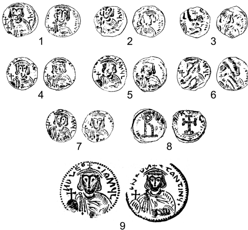
Рис. 2. Чамну-бурунский клад и реконструкция штемпеля, использованного для производства подражаний (по А. Г. Герцену и В. А. Сидоренко)

1, 2 — фотографии из публикации А. М. Гилевич: натуральная величина (1), увеличено в два раза (2); 3 — бракованный гемифоллис Михаила III (по И. В. Соколовой); 4 — стандартная монета этой разновидности.