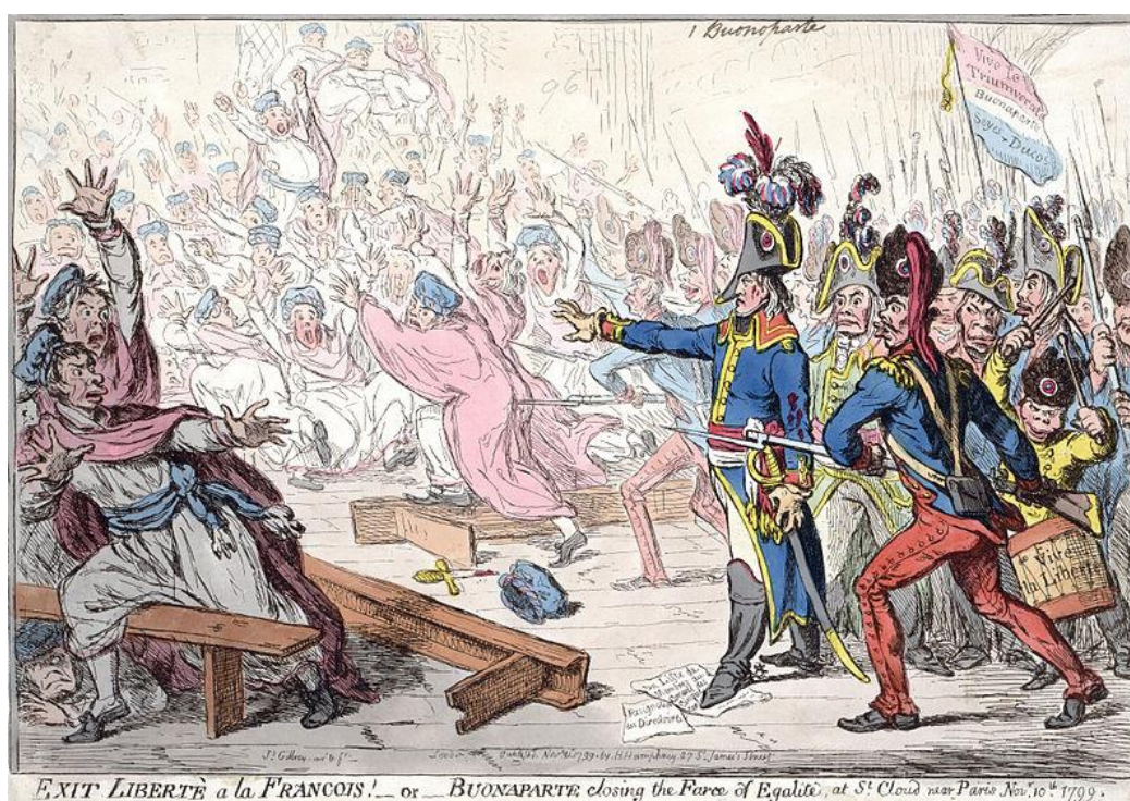
Рис. 2. «Конец французской свободы или Буонапарте, закончивший фарс Равенства, в Сен-Клу», Дж. Гилрей (1799)

Одной из самых популярных тем политической карикатуры Дж. Гилрея в конце XVIII в. была Французская революция. Так в карикатуре «Буонапарте, завершающий фарс Egalité» Наполеон со своими гренадерами штыками вытесняет членов Совета пятисот из оранжереи в Сен-Клу (рис. 2) [11]. На барабане, который держит в руках один из солдат, зритель мог прочесть надпись: «Да здравствует свобода!», а на бумагах под ногами написано: «Отставка директората» и «Список членов Совета 500». Карикатура стала иллюстрацией британского взгляда на государственный переворот во Франции, состоявшийся 18 брюмера, в результате которого Директория лишилась власти, представительные органы (Совет пятисот и Совет старейшин) были разогнаны, и Наполеон возглавил новое правительство.