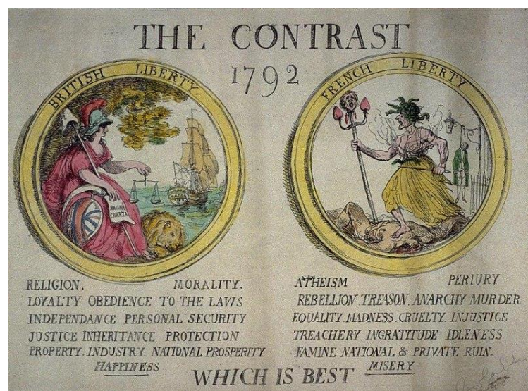
Рис. 4. «Контраст 1792 – Что лучше», Т. Роулэндсон (1792)

тощее уродливое и плохо одетое олицетворение Франции, которая подобна Медузе Горгоне со змеями вместо волос. Насадив на пику чью-то отрубленную голову, Франция топчет обезглавленный труп на фоне человека, повешенного на фонарном столбе. Под этим изображением надпись: «Атеизм, Лжесвидетельство, Восстание, Измена, Анархия, Убийство, Равенство, Безумие, Жестокость, Несправедливость, Предательство, Неблагодарность, Праздность, Голод, Национальное и Частное Разрушение, СТРАДАНИЕ». Внизу карикатуры большим шрифтом общий вопрос: «Что лучше?».