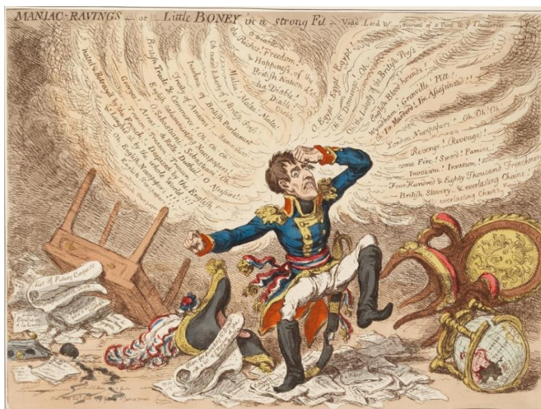
Рис. 8. «Бредящий маньяк, или Маленький Бони в сильном припадке», Дж. Гилрей (1803)

В карикатуре «Бредящий маньяк, или Маленький Бони в сильном припадке», опубликованной в мае 1803 г., Дж. Гилрей изобразил момент, когда Наполеон прочитал газетные репортажи о себе (рис. 8) [14]. Токая ногами и сжав кулаки, он в ярости опрокинул стол. Причина его неистовой истерики раскрывается в тексте над его головой, гласящем: «Английские газеты! О, английские газеты; ненавидимый и преданный французами; презираемый англичанами; над ним смеется весь мир; измена; вторжение; четыреста восемьдесят тысяч французов в британском рабстве – и вечных цепях».