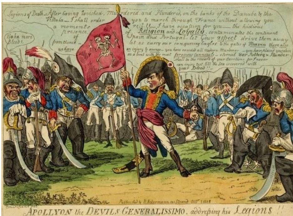
Рис. 7. «Аполлион, генералиссимус дьяволов, обращается к своим легионам!», Дж. Крукшенк (1808)

В карикатуре «Бредящий маньяк, или Маленький Бони в сильном припадке», опубликованной в мае 1803 г., Дж. Гилрей изобразил момент, когда Наполеон прочитал газетные репортажи о себе (рис. 8) [14]. Токая ногами и сжав кулаки, он в ярости опрокинул стол. Причина его неистовой истерики раскрывается в тексте над его головой, гласящем: «Английские газеты! О, английские газеты; ненавидимый и преданный французами; презираемый англичанами; над ним смеется весь мир; измена; вторжение; четыреста восемьдесят тысяч французов в британском рабстве – и вечных цепях».