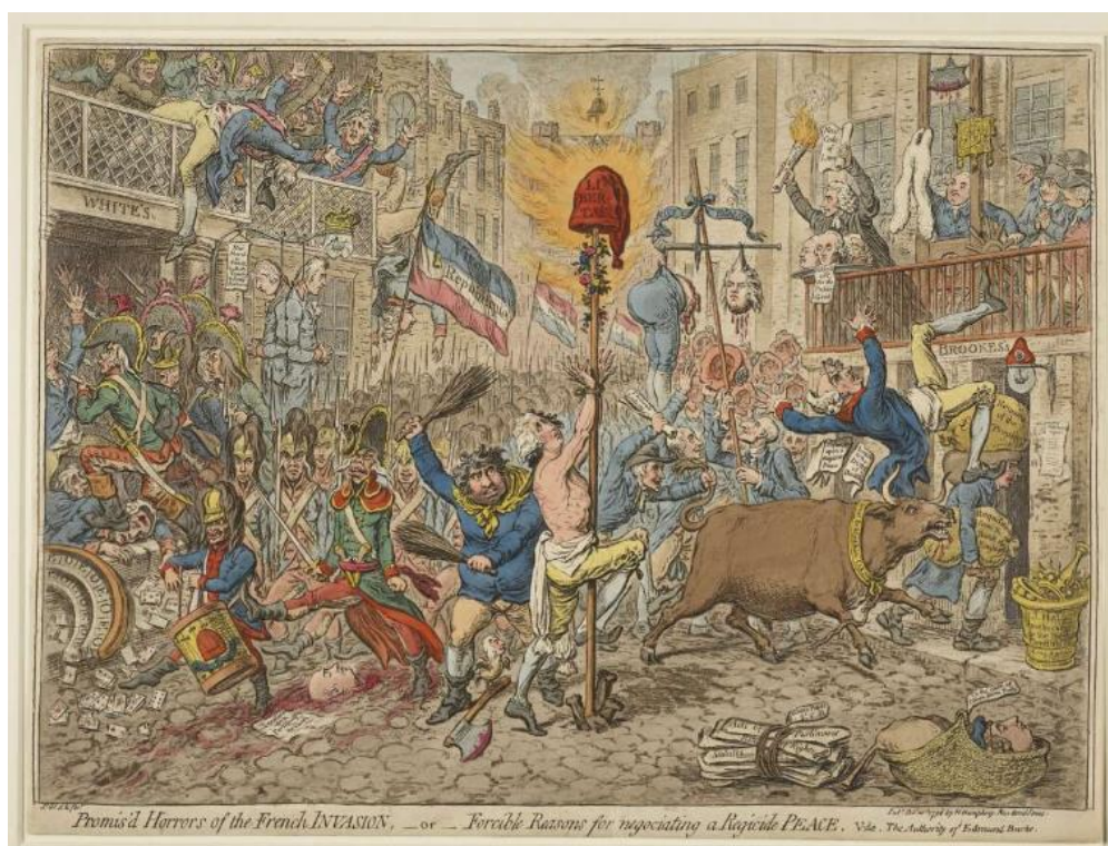
Рис. 5. «Обещанные ужасы французского вторжения», Дж. Гилрей (1796)

В карикатуре «Обещанные ужасы французского вторжения» Дж. Гилрей фантазирует на тему возможного вторжения Франции в Великобританию (рис. 5) [15]. Французские войска с примкнутыми штыками маршируют по Сент-Джеймс-стрит. Вдали пылают ворота Сент-Джеймского дворца. На переднем плане карикатуры изображено «Дерево свободы» (столб, украшенный цветами и увенчанный большой шапкой с надписью «свобода»). К дереву привязан У. Питт, раздетый до пояса, а Дж. Фокс (слева) яростно бьет его розгами.