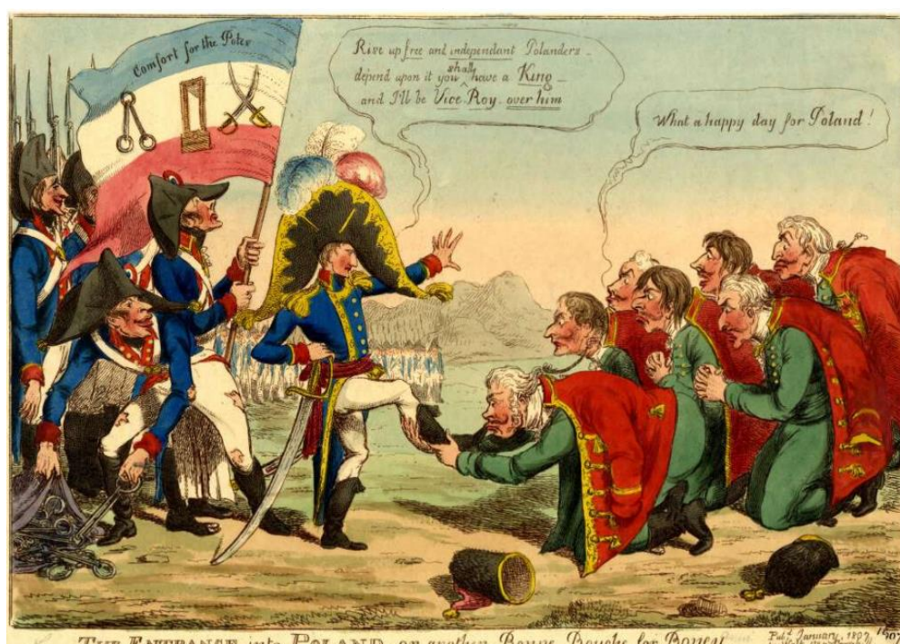
Рис. 9. «Вход в Польшу или другой Бонн Буш для Бони», Ч. Уильямс, (1807)

В ноябре 1806 года Наполеон со своей армией вошел в Польшу. Неизвестный художник изобразил это в карикатуре «Вход в Польшу или другой Бонн Буш для Бони» (рис. 9) [9]. Польские магнаты стоят на коленях и восклицают, целуя сапог Наполеона: «Какой счастливый день для Польши!». Наполеон в свою очередь высокомерно возвещает им о свободе и независимости поляков. Позади знаменосец несет флаг, на котором изображена пара оков, гильотина и два скрещенных меча с надписью «Комфорт для поляков». Рядом с ним другой французский солдат в рваной форме с насмешкой достает оковы из мешка.