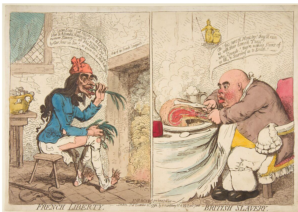
Рис. 3. «Французская свобода. Британское рабство», Дж. Гилрей (1792)

186]. Самой известной из целого ряда подобных работ стала гравюра «Французская свобода. Британское рабство» (рис. 3) [12]. Слева на ней был изображен обезьяноподобный голодающий санкюлот-модник, сидящий в лохмотьях. Вероятно, по задумке автора, он являлся олицетворением нового режима. Даже его скудная еда (улитки и луковичные головки), дом-развалина (об этом ярко свидетельствуют убогое убранство комнаты, разбитое стекло, кирпичи, проступающие сквозь облезшую штукатурку) не мешают ему радоваться тому, что он свободный гражданин. Справа уже известный собирательный образ англичанина – заплывший жиром Джон Бульль, поедая огромный кусок ростбифа и запивая его кружкой пива, не может перестать думать о повышении налогов.