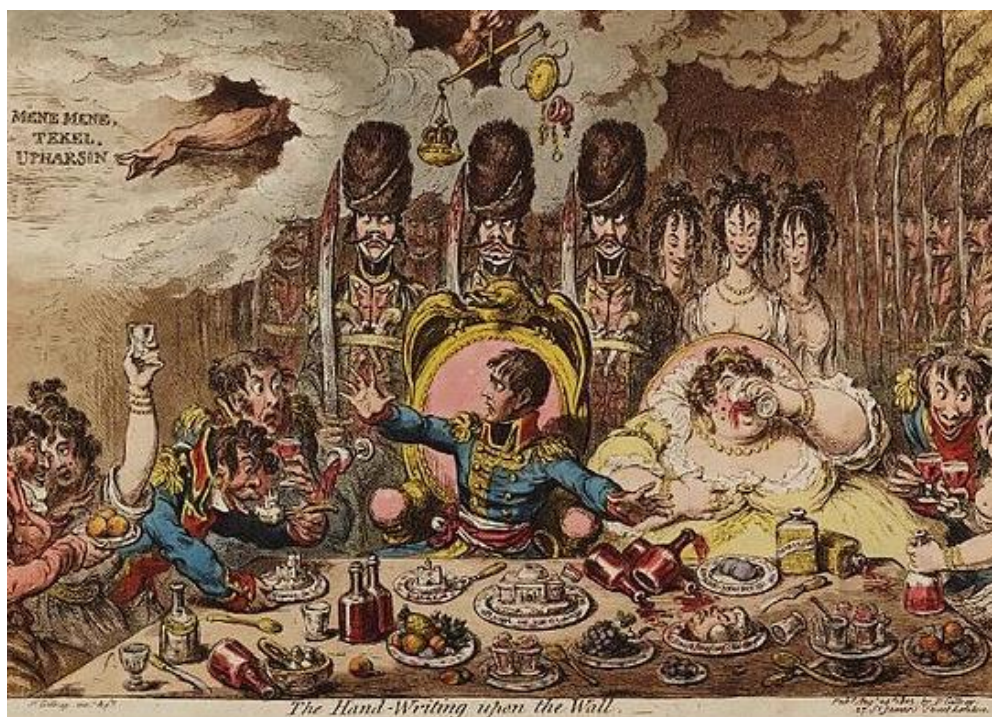
Рис. 6. «Надпись на стене», Дж. Гилрей (1803)

пророческую надпись на стене, на которую указывает длань Бога. Над головой Первого консула другая рука Бога держит пару весов, на которых корона Франции весит тяжелее, чем шапка свободы, под которой скрыт деспотизм Наполеона.