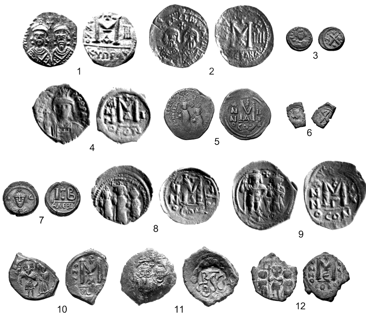
Рис. 1. Медные монеты Ираклия I

1—3 — периода восстания: фоллисы чекана Кипра (1) и Александрии (2), а также деканнумий эмиссии Карфагена (3); 4 — фоллис первого года правления, чекан Константинополя; 5 — фоллис Ираклия I и Ираклия II Константина третьего года правления, чекан Константинополя; 6 — деканнумий Ираклия I, чекан Константинополя; 7 — монета в двенадцать нуммов, чекан Александрии (620-е гг.); 8 — фоллис Ираклия, Ираклия II Константина и Мартины (615—624 гг.), чекан Константинополя; 9 — константинопольский фоллис Ираклия I (630 г.); 10 — фоллис 631—640 гг., чекан Константинополя; 11 — сицилийский фоллис, выпущен в последние годы правления Ираклия I; 12 — константинопольский фоллис 640—641 гг.