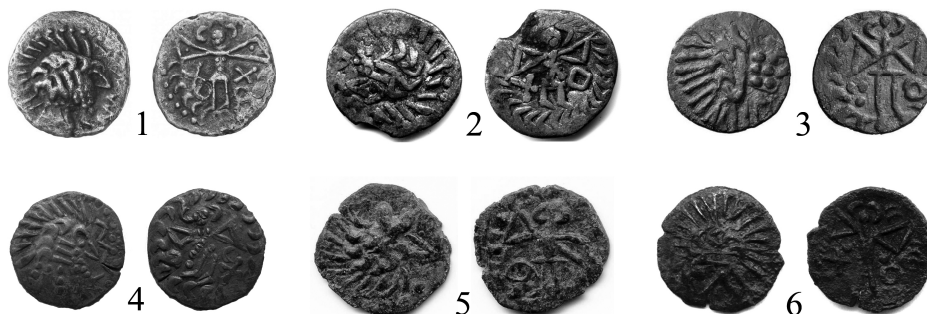
Рис. 1. Таманские денарии