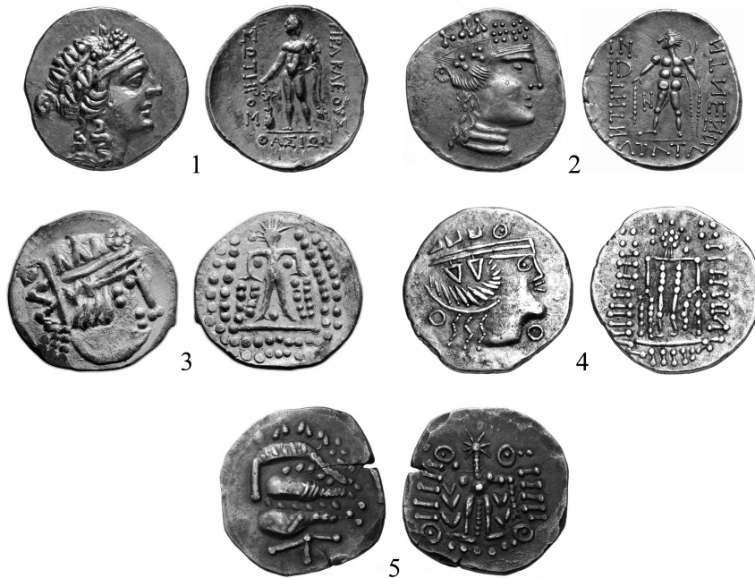
Рис. 3. Тетрадрахма Фасоса (1) и подражания ей (2–5) фракийского чекана