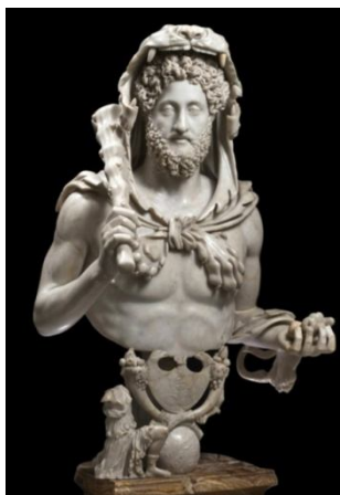
Рис. 2. Коммод в облике Геркулеса