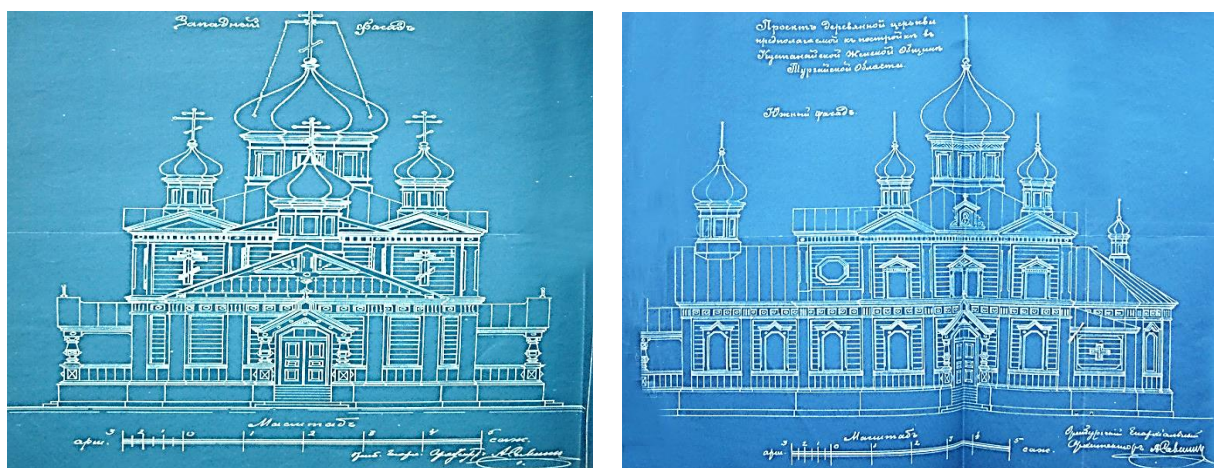
Photo 3. Design drawings of a wooden church in the Kostanay female community of Turgay region [24]