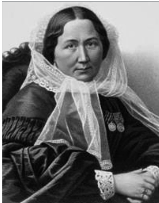
Прасковья Ивановна Орлова-Савина. Praskovia I. Orlova-Savina.

В 1855 г. в БЗ доставили медицинскую литературу 8 . Руководство больницы попросило разрешения выписывать сверх нормы для тяжёлых больных чай, сахар, вино, водку, уксус, табак и медикаменты 9 , но продуктов не доставало. При этом первыми потребовали улучшения пайка в сентябре 1855 г. военные и гражданские чиновники, находившиеся в больнице: они добились выдачи себе сверх положенной порции ещё по фунту мяса и коровьего масла 10 . Цинготным больным выписывали по кружке хорошего пива сверх порции 11 . Весной в городе появилась холера. Хотя в БЗ не было отдельной палаты для холерных больных, всё равно в мае сюда привезли 24 заболевших человека. А ведь в больнице и так находились вдвое больше больных, чем было положено, и даже заготовленные на случай холеры комиссариатские вещи (92 рубахи, 42 простыни, 20 тюфяков) не могли закрыть потребность при таком числе больных. Сказывалась катастрофическая нехватка свободных мест и отсутствие средств на наём прислуги, покупку посуды. 1 июня губернатор предложил открыть временную холерную больницу в старом доме Перовского и возглавить её должен был врач БЗ Н.В. Плешков. Но дом требовал ремонта, а число заболевших увеличивалось, и губернатор приказал всё-таки «очистить какое-то помещение в БЗ» 12 . В 1855 г. в сим-